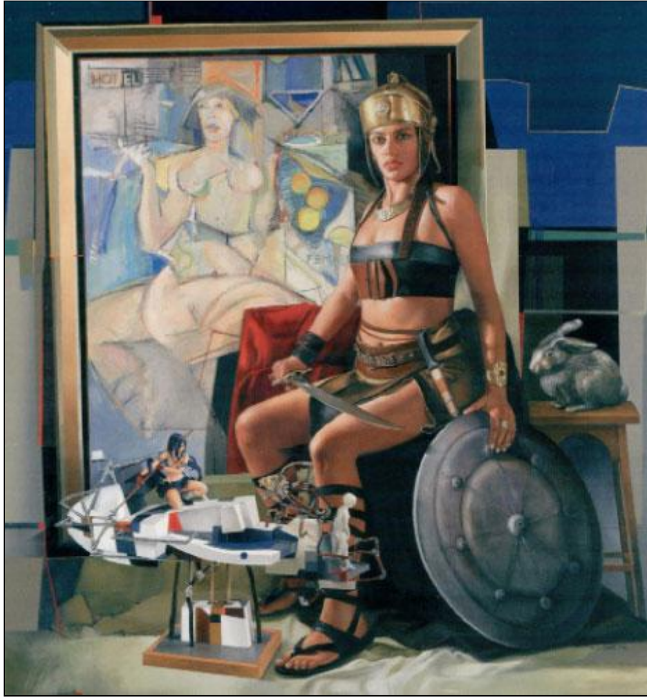
«المختصة» (زيت وأكريليك على كانفاس – 140 × 150 ستم – 2014)

لوحة محمد الروّاس لوحة صادمة، تقول أحوال الجسد الأنثوي وتحولاته ومخاضاته. لوحة الروّاس لوحة سياسية، تنظر بريبة نقدية إلى العصر، وتمجد المرأة، وتحث على التمرد والقطيعة. وتحرض على الرغبة. لوحة الروّاس درس في تاريخ الفن، تسائل الهوية الثقافية. لكن، على الرغم من لوحته الصادمة، لا يترك لنا أن نتهمه بالاستفزاز، بسبب كل هذا الامتلاء والسكون الظاهري، وتلك الرقة في النظر الى الجمال الأنثوي، والهوس بتفاصيل الأشياء والأكسسوارات والأدوات والآليات. هو الذي لا يرفع شعاراً، ولا يلقي درساً، ولا يلقي خطاباً، يقدم لنا لوحة سياسية بامتياز، تشكك في الثوابت، تجاهر بالرغبة، تسخر من النظام والطلامية، وتقصي الذكورة المستبدة... في لوحته، بحسيتها، وشيقيتها، وسخريتها وإحالاتها المعرفية، يمكن أن نجد جمهوريتنا الفاضلة.