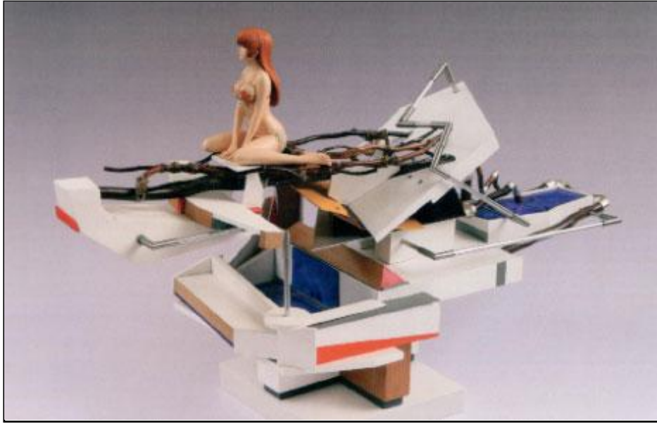
«مسبح طائر» (خشب، خشب رقائقي، المنيوم، فولاذ مقاوم للصدأ، شريط مطلي بالفضة، بليكسيغلاس، أغصان صفصاف، فتل، طلاء أكريليك، تمثال من الراتنج - 30 × 70 × 43 ستم - 2013)

أمام هذه اللوحة المثقفة يعبر جزء من تاريخ الفنّ، وتاريخ الفكر والثقافة والحضارات، يعيد الفنان قراءتهما/ كتابتهما على طريقته. يمضي في اقتفاء «الأثر» الذي يعطي للأشياء معناها، للوجود معناه... لذلك فإن الداخل إلى لوحة محمد الروّاس ليس كالخارج منها. هو الذي أفعدنا ذات مرّة على كرسي فان غوغ الفارغة تنفيذاً لوصية أبي نؤاس «الشعوبية» («قل لمن يبكي على رسم درس...»). اللوحة؟ كيف يمكن للمسطح الذي يتماهى مع الأفق، مع الفضاءات، مع الجلد الأثوي، أن يتسع إلى كل هذه الطبقات والتواءات، الأزمنة والحكايات، ويبقى مجرد «لوحة»؟