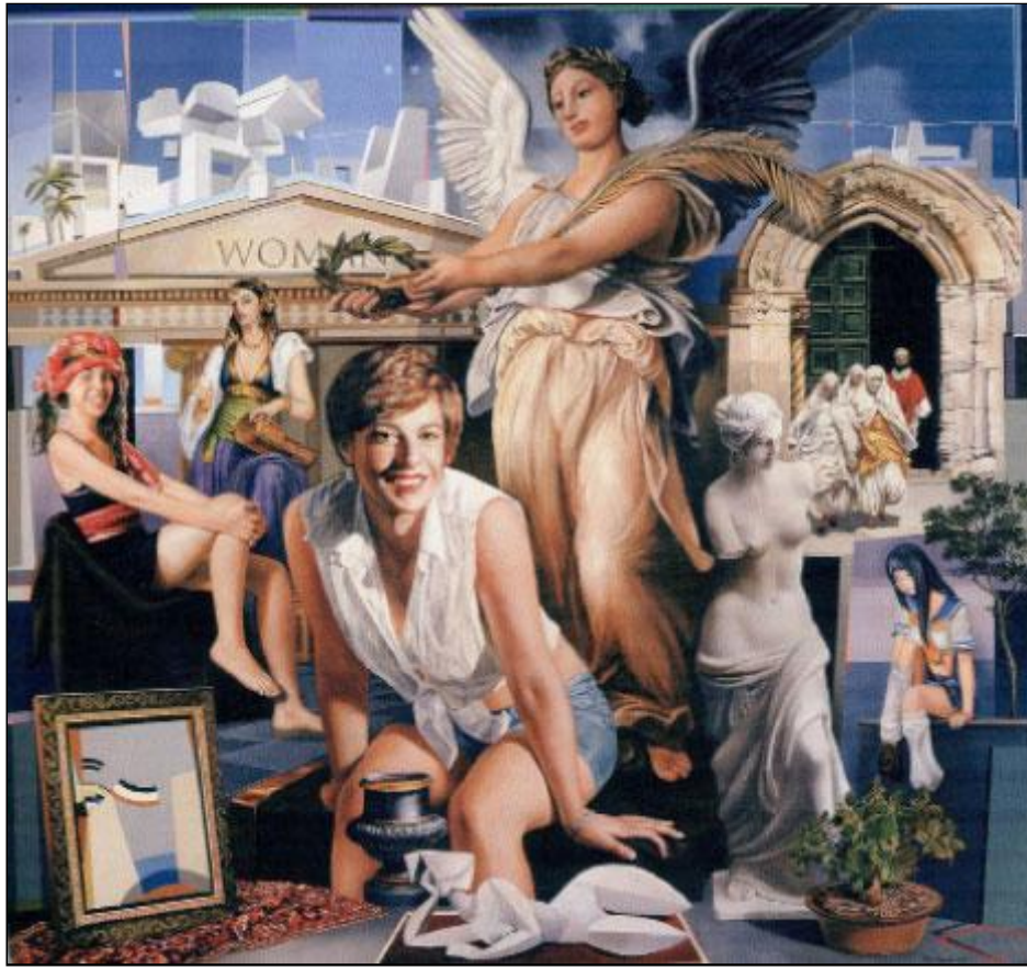
«تمجيد المرأة» (زيت، وأكريليك وجرافيت على كانفاس – 150 × 160 سنتم – 2015)