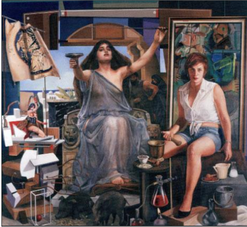
«مساعدة سيرسيه» (زيت وأكريليك على كانفاس - 140 × 150 سنتم - 2014)

يضع الفنّان مهارته الحرفيّة في خدمة فلقه النفسي والميتافيزيقي والثقافي، فيعمل على تقطيع اللقطة وتطعيمها وترصيعها. خطابه الفكري لا ينفصل عن السؤال الأسلوبى الكامن في كل عمل، والنزعة المتجددة إلى تجاوز الحدود التي تحرك التجربة برمتها. وأعمال مرحلته الأخيرة هي ثمرة هذا التطور المنطقي للرؤيا والأسلوب. مع مفاهيم كالامتلاء الدرامي والتراكم البصري والازدحام السينوغرافي، ندخل في صلب تلك الأعمال التي يضمّ المعرض الحالي أهم نماذجها (زيت وأكريليك على كانفاس، أو خشب). لقد بلغ محمد الروّاس هنا ذروة مراجعة الذات، أو المواجهة مع الذات. فجمع كل قصصه، نسائه، حيواته، وعوالمه في لوحة واحدة. تقنيته الدراميّة الأثيرة منذ سنوات طويلة، أي الفنّ داخل الفن، واللوحة داخل اللوحة، تصل هنا إلى أقصى احتمالاتها... إنّها لعبة المستويات - أو «التقعير» mise en abyme - التي تترك للحكاية الصغيرة، في قلب الحكاية الأكبر، أن تشحن ديناميّة الخطاب، وتسلطّ أضواء إضافية على المعنى. في عمق «المسرح»، أعاد رسم زبنيّاته الأولى التي تعود إلى أواسط السبعينيات، وفي المقدمة «وضع» (نقصد: أعاد رسم) مجسّماته الهاربة من قصص الخرافة العلميّة، أو منحوتات صديقة، أو تفصيل من لوحة قديمة له (المرأة العارية المستلقية، وهي يحد ذاتها محاورة مع فنّانين سابقين مثل مارسيل دوشان).